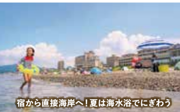
宿から直接海岸へ!夏は海水浴でにぎわう