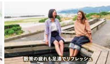
散歩の疲れも足湯でリフレッシュ