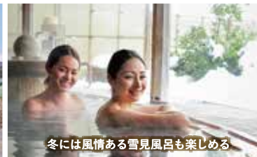
冬には風情ある雪見風呂も楽しめる