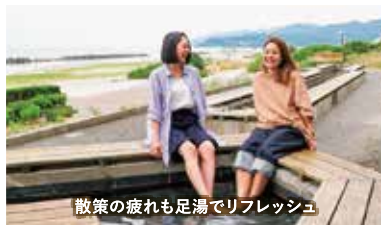
散歩の疲れも足湯でリフレッシュ