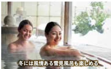
冬には風情ある雪見風呂も楽しめる