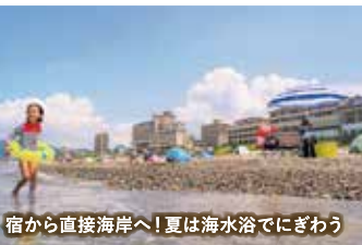
宿から直接海岸へ!夏は海水浴でにぎわう